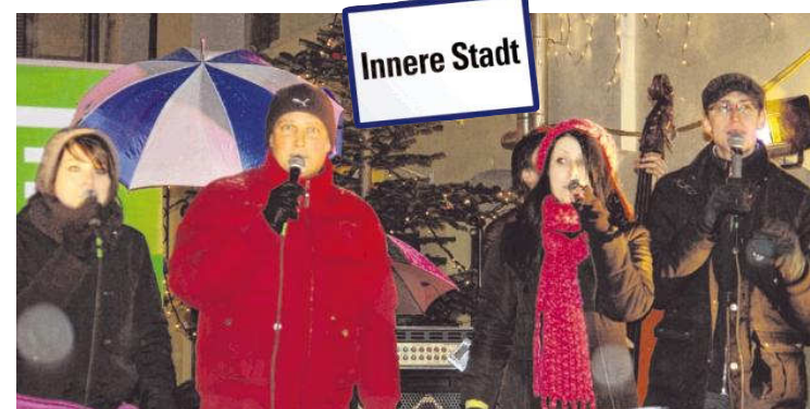
Die Jazz-Formation „Obsession“ bei ihrem Benefizkonzert im Herzoghof KK

wurde beim Verladen nach dem Konzert ein Laptop und Equipment in Höhe von 5.000 Euro gestohlen. Genau deswegen stellte sich die Formation in den Dienst der guten Sache und veranstaltete ein Benefizkonzert. „Wir lassen uns von niemandem Weihnachten versauen“, so die allgemeine Nachricht der Band an die Diebe. Somit hatte der Abend zwar einen ernsten Hintergrund, der Spaß stand aber im Vordergrund.